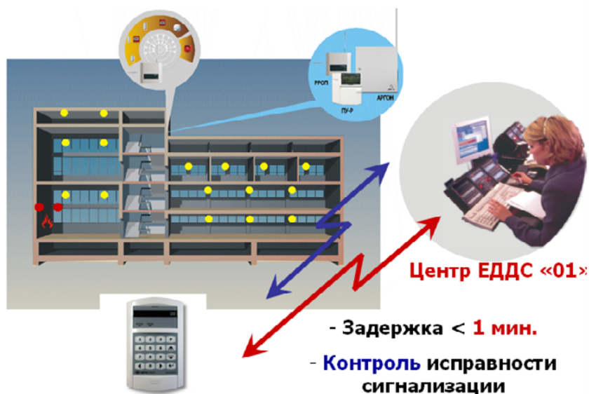
Рисунок 2. Алгоритм функционирования пожарного мониторинга объектов защиты

Применение двухстороннего радиоканала позволило существенно расширить функциональные возможности системы мониторинга. В настоящее время добавились функции системы оповещения. Это передача и трансляция речевой и текстовой информации в случае чрезвычайной ситуации на все устройства системы оповещения или на их группу.