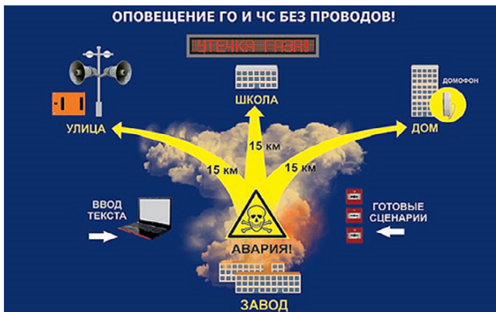
Рисунок 1. В условиях ЧС существует высокий риск повреждения кабельных линий связи. И в этом случае оптимальным решением является выделенный для нужд МЧС России радиоканал

- обеспечение согласованности действий в чрезвычайных ситуациях органов исполнительной государственной власти и органов местного самоуправления, своевременности, полноты и достоверности представляемой руководству информации, единой вертикали управления в чрезвычайных ситуациях.