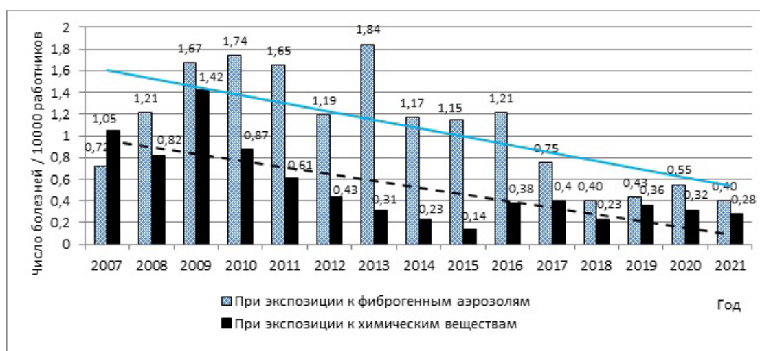
Рисунок 2. Ежегодные уровни заболеваемости профессиональными болезнями органов дыхания при воздействии фиброгенной пыли и аэрозолей химических веществ в 2007-2021 годах

Несмотря на вышеуказанные положительные изменения, подтверждена высокая распространенность аэрозолей вредных химических веществ и фиброгенной пыли на рабочих местах предприятий в АЗРФ [2, 7, 9]. Они занимали третье и восьмое место в структуре вредных производственных факторов. Важно, что при большем удельном весе аэрозолей химических веществ среди потенциальных причин развития профессиональной патологии, фиброгенная пыль являлась причиной в 2,04 раза большего числа случаев заболеваний, а также то, что ежегодная заболеваемость при воздействии фиброгенной пыли была в 1,48 – 8,21 раза выше, чем при воздействии аэрозолей химических веществ (кроме 2007 года). Кроме того, в случае экспозиции к фиброгенной пыли был более высоким риск формирования профессиональной патологии ( OR=3,23 ; 95%ДИ 2,89-3,61). Представленные данные могут свидетельствовать о меньшей эффективности средств индивидуальной защиты органов дыхания при пылевом воздействии по сравнению с аэрозолями химических веществ. Вероятной причиной также представляются недостаточная эффективность или неадекватное применение существующих систем пылеподавления [6].