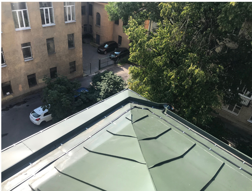
Рисунок 1 – Система антиобледенения кровли (пример)..

Особенностью аморфных сплавов является отсутствие у них дальнего порядка в расположении атомов (трансляционная симметрия). Структура аморфных магнетных сплавов характеризуется отсутствием у них в строгой периодичности, присущей кристаллическому строению, в расположении атомов ионов молекул на протяжении сотен и тысяч периодов параметров кристаллической решетки. Считается, что отсутствие дальнего порядка в расположении атомов в аморфном состоянии приводит к изотропии магнитных свойств [1].